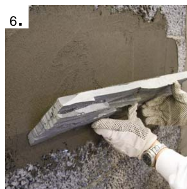
Steinpanelen presses godt inn i flislimet.