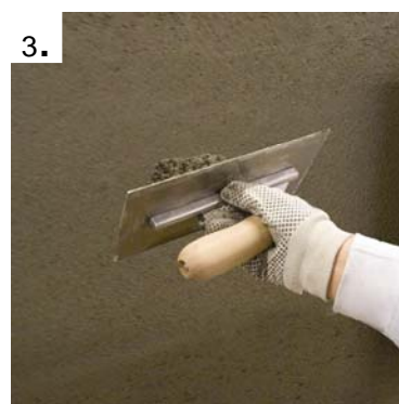
Flislimet trekkes på veggen med Brett.