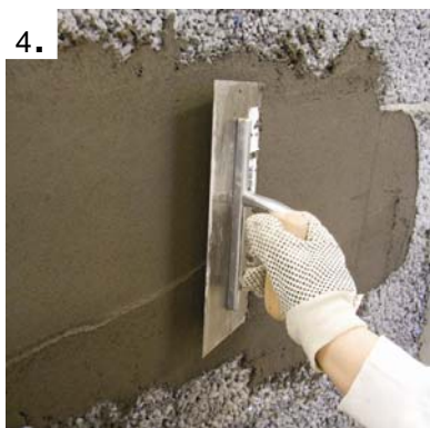
Smør og Jobb flislimet utover flaten.