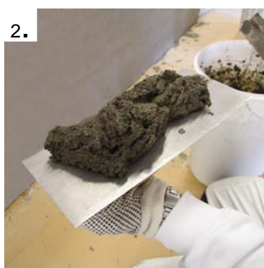
Fyll brettet med egnet flislim,