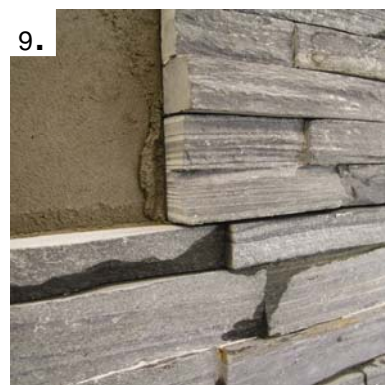
Legg neste steinpanel forbandt.