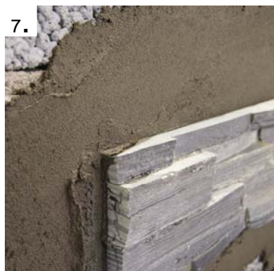
Steinpanelen skal ikke fuges.