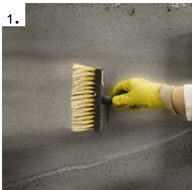
Sugende underlag primes.